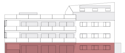
FAÇADE SUD ▲

Appartement de 3.5 pièce pratique et confortable, prolongé par un vaste jardin privatif dans un environnement calme.